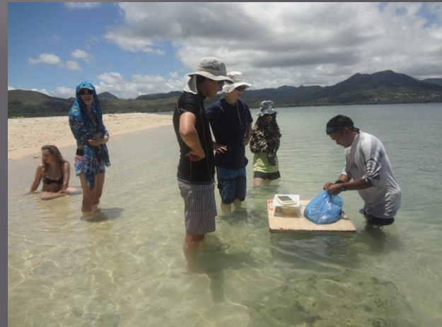
Préparer la salade Tahitienne