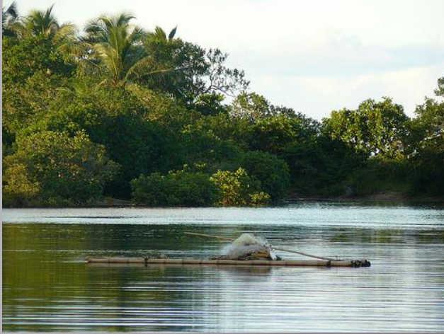
Le radeau en bambou