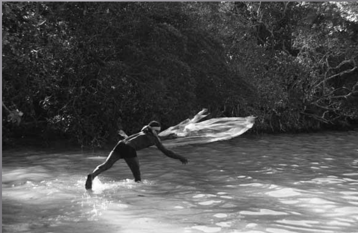
Lancer de l'épervier